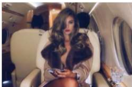
Mati samohranilka iz Kranja razkriva, kako z brezplačno aplikacijo zasluži 5400 evrov na teden

V policiji še vedno zaznavamo porast problematike z investicijskimi vlaganji v lažne spletne platforme. Problematika je začela izstopati že v letu 2020, ko je bilo obravnavanih 83 zadev s skupnim oškodovanjem v višini več kot dva milijonov evrov. Letos pa je bilo do konca avgusta obravnavanih že 115 zadev s skupnim oškodovanjem v višini več kot pet milijonov evrov! Vsem, ki jih mika obet hitrega zaslužka, zato v policiji svetujemo, naj bodo izjemno previdni in naj vsako tako "čudežno" ponudbo raje dobro preverijo.