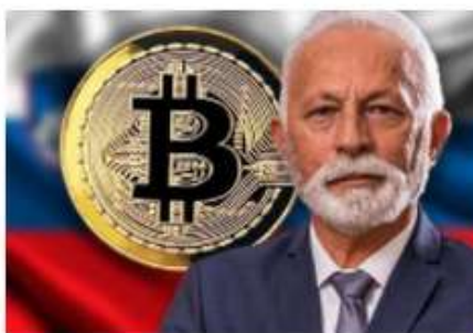
Nova platforma za trgovanje z Bitcoinimi je vir za nove slovenske milijonarje