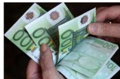
Če živite v Ljubljana, lahko dobite 2250 evrov na teden